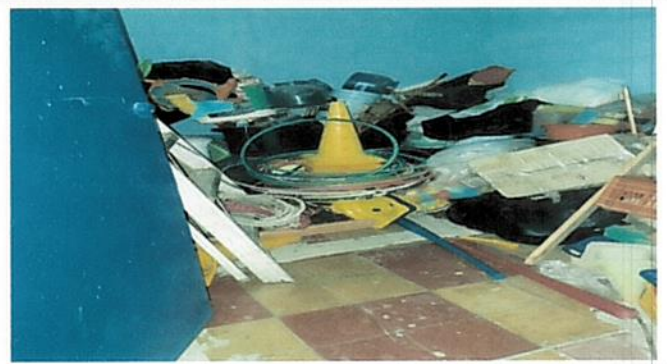
Foto 2: Anteriormente baños para niños, inhabilitados debido a que las raíces de los árboles obstruyeron