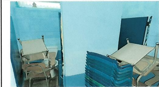
Foto 1: Baños para niñas inhabilitados y drenajes obstruidos por raíces de los árboles